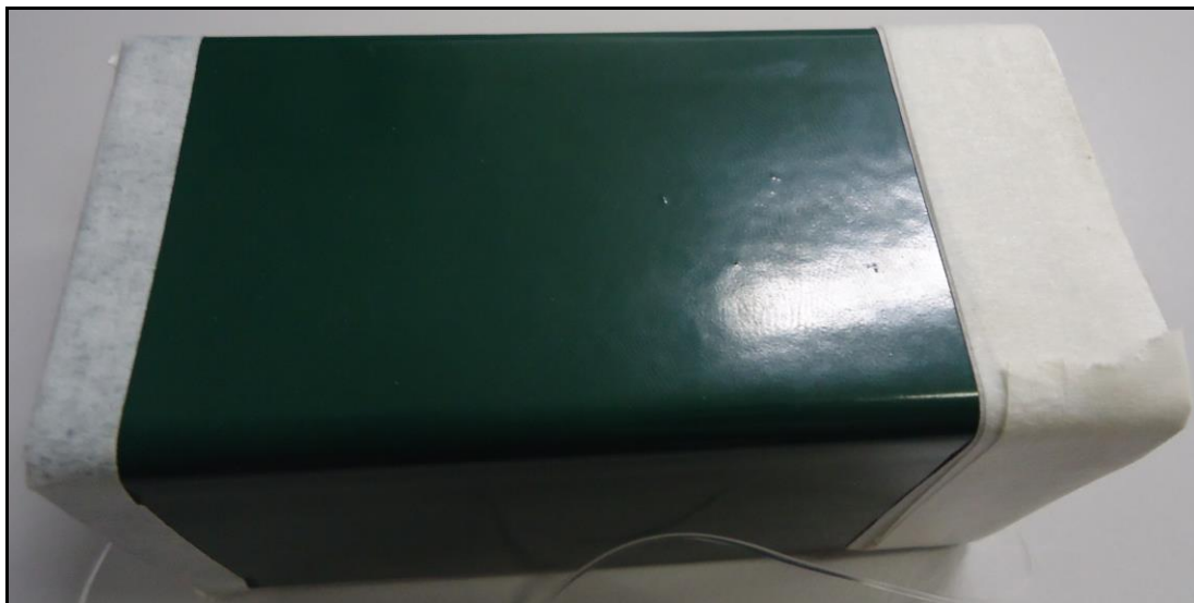
Fotografia nº 1 – Antes do Ensaio